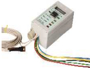
Vollautomatische Steuerung des Betriebs