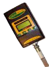
Kontinuierliche Überwachung der Ölqualität